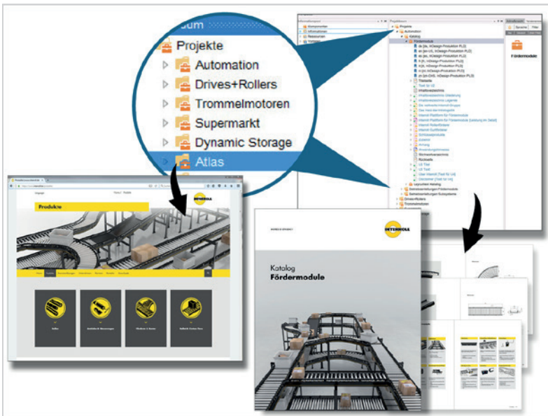
Re-use und Cross Media Nutzung der Inhalte aus Schema ST4 für die Produktseiten im Web und im Printkatalog

Produktdaten, Bilder und Grafiken können in ST4 als einzelne Bausteine abgespeichert werden. So sind Textmodule und Grafikknoten medienneutral einsetzbar und beliebig oft zu verknüpfen. Diese Wiederverwendung vereinfacht den Publikationsprozess wesentlich und erspart Aufwand und Kosten.